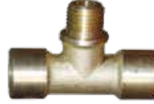
ORTA BACAĞI TE